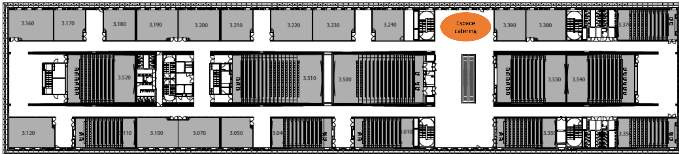
Maison du Savoir - 3ème étage